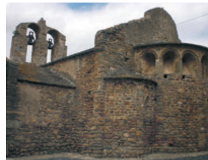
Església de Sant Joan de Palau-saverdera. Fons CCAE

histórica de la Ciutadella de Roses. La Ciutadella está dotada de un interesante centro de interpretación, que da a conocer la evolución histórica del monumento, desde la prehistoria hasta nuestros días.