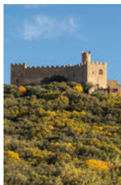
Castell de Requesens (La Jonquera).

La riqueza patrimonial y artística de l'Empordà se ve reflejada en una gran cantidad de edificios de distintos momentos del románico y del gótico, que incluye desde pequeñas iglesias ocultas en parajes naturales de difícil acceso, hasta monasterios que vivieron épocas de gran esplendor, castillos roqueros, iglesias con pinturas románicas, villas fortificadas... Este rico legado tuvo a menudo a señores laicos y eclesiásticos como mentores, quienes, temerosos, querían ganarse el cielo, y encargaban y financiaban este patrimonio. Cabe destacar el legado románico ampurdanés, prueba de que nos encontramos en una tierra con un patrimonio de belleza excepcional e importancia histórica. Así, por ejemplo, el monasterio de Sant Quirze de Colera conserva el claustro románico con capiteles más antiguo de Europa. Alguna de las piezas excepcionales de arte de este periodo se pueden contemplar en el Museo de Arte de Girona (M'dA).