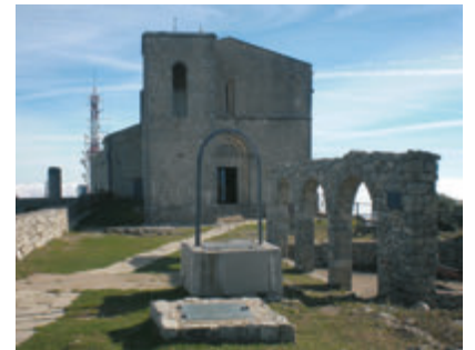
Santuari de la Mare de déu del Mont.

Esta parte de la ruta se inicia en el pueblo de Lladó , donde se pueden visitar los restos de los edificios que conformaban la antigua colegiata. Del monasterio de Sant Joan solo queda la iglesia de Santa Maria , restos del claustro, de las dependencias monacales y de la sala capitular. Es importante destacar por su importancia el conjunto escultórico de la fachada románica de la iglesia de Santa Maria. El monasterio fue fundado por un monje de la canónica de Vilabertran. De aquí podéis coger la tortuosa carretera local GIP-5237 para visitar el monasterio románico benedictino de Sant Llorenç de Sous , con restos de los siglos XI-XIV. El cenobio está formado por dos cuerpos principales: la iglesia y el claustro con las dependencias monacales. Los restos del edificio han sido recientemente restaurados, y cuenta con carteles explicativos detallados de su historia. Finaliza la ruta en el santuario de la Mare de Déu del Mont , construido sobre un antiguo castillo medieval del s.XIV, con unas vistas espectaculares de L'Empordà y las comarcas vecinas, que inspiraron las obras del escritor Mossèn Cinto Verdaguer.