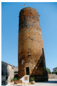
Cruïlles. Aj. de CMSS