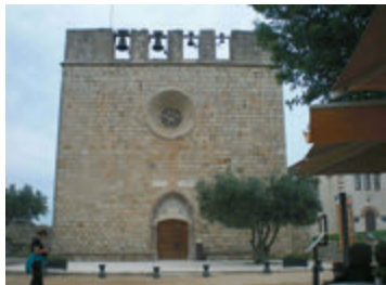
Església de Sant Martí d'Empúries (L'Escala).

La ruta comienza en el pueblo de Sant Martí d'Empúries . Situado en un promontorio sobre el mar, que había sido una isla habitada desde los siglos IX-VIII a.C., fue la antigua capital del condado de Empúries, antes que esta capitalidad fuera trasladada a Castelló d'Empúries. El pueblo conserva aún la muralla medieval y diferentes elementos románicos de la iglesia de Sant Martí. Se puede proseguir la ruta hacia el municipio de Sant Pere Pescador, entre marismas y manzanares, y se llega a Castelló d'Empúries . Fue la capital del condado de Empúries desde el s.XI hasta el XV. La basílica gótica de Santa Maria (s.XII-XV), conocida con el nombre de "la catedral de l'Empordà", y los vestigios de los antiguos edificios y conventos son el testimonio del esplendor de este municipio durante la edad media. Otros monumentos importantes son: el Portal de la Gallarda y sus murallas, la Casa Gran (s.XV), la Llotja o Consolat del Mar (s.XIV), el Palau dels Comtes o Convent de Sant Domènec, el Pont Vell, el Rentador (el lavadero), el Call Jueu (barrio judío) y la Cúria-pressó (s.XIV), que alberga el centro de interpretación de la historia de la localidad, así como una colección del patrimonio judío local. Uno de los momentos más mágicos de Castelló d'Empúries llega, cada año, durante la segunda semana de setiembre cuando se celebra el festival "Terra de Trobadors" y la villa retorna a su vibrante pasado de la época medieval.