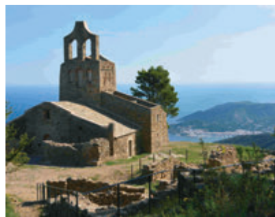
Església de Santa Helena (El Port de la Selva).

Para visitar el monasterio románico de Sant Pere de Rodes debéis tomar la carretera GIP-641 desde el municipio de Vilajuïga. Este conjunto excepcional está formado por el monasterio de Sant Pere de Rodes; el castillo de Sant Salvador de Verdera del s.XIII, solo accesible a pie ( 25 min.); el poblado medieval de Santa Creu , y la iglesia prerománica de Santa Helena . El monasterio de Sant Pere de Rodes, desde su magnífica situación, a 520m de altura, comprende diferentes edificios de origen románico, entre los cuales destaca la basílica del s.X. El monasterio ha sido cuidadosamente restaurado, de forma que permite conocer su historia y la del territorio. Cogiendo la carretera GI-610, se puede visitar Palau-saverdera para admirar la iglesia de Sant Joan , y finalizar la ruta en Roses , visitando el monasterio románico de Santa Maria (s.XI), situado en el interior del conjunto de gran importancia