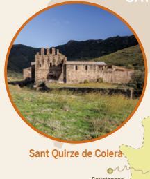
Sant Quirze de Colera