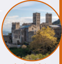
Sant Pere de Rodès