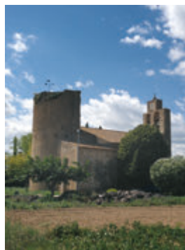
La Tallada d'Empordà.

Esta ruta empieza en Albons , donde queda ya muy poco del antiguo castillo, pero se divisa bien un territorio que fue testigo de muchas disputas entre el conde de Empúries y el rey. En Bellcaire d'Empordà se conserva el castillo palacio , actualmente sede del ayuntamiento, pero que fue residencia de los condes. Desde este punto notaréis la presencia de un castillo en lo alto del Montgrí, símbolo del poder real. La representación "Bandera de Catalunya" hace revivir cada año esos enfrentamientos. También es destacable la Iglesia de Sant Joan , de origen prerrománico que conserva un altar románico. Continuaréis por Tor hasta llegar a la Tallada d'Empordà , que guarda un notable núcleo histórico y desde donde podéis acceder a la iglesia de Sant Esteve de Marenyà , con interesantes pinturas murales. Seguiréis hasta Verges , antiguo feudo del condado de aspecto amurallado. Cada Jueves Santo tiene lugar "La Processó de Verges", fiesta declarada de interés patrimonial que incluye "La Dansa de la Mort", manifestación de origen medieval. Podéis complementar la ruta pasando por la ermita de Sant Pere de la Vall y recorrer un territorio muy desconocido por los pueblos de Garrigoles y Vilopriu que os llevarán a Colomers.