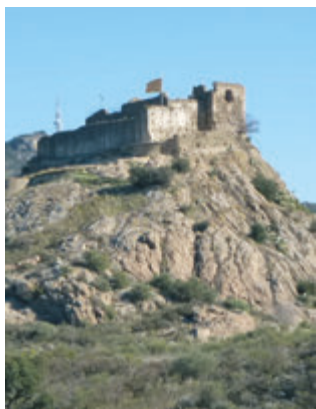
Castell de Quermançó (Vilajuïga).

que cuenta con el claustro de este estilo artístico más antiguo de Europa. Está situado en un lugar de gran belleza del Paraje Natural de Interés Nacional de L'Albera. A continuación, volveremos por los pueblos de Vilamaniscle y Garriguella para retomar la carretera N-260, en dirección al municipio de Llançà. Por el camino, podréis contemplar el singular castillo de Quermançó . Este itinerario finaliza en la localidad de Llançà con un recorrido por el centro histórico, donde aún se conserva la torre del campanario (s.XIII) de la antigua iglesia románica, actualmente desaparecida.