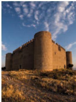
Castell del Montgrí. Aj. Torroella de Montgrí. J. Renart

Esta última parte transcurre por el llano de los ríos Ter y Daró, antigua zona de ciénagas y un territorio muy disputado en la edad media. Pequeños núcleos, algunos elevados sobre montículos, forman parte del paisaje, presidido en todo momento por el Montgrí y su castillo. Desde Parlavá , dirección Torroella de Montgrí, podéis descubrir el núcleo de Fonolles , con restos del antiguo castillo. Pocos kilómetros después, Sant Iscle d'Empordà bien merece una visita. Seguiréis hasta Serra de Daró donde, dirección a la Bisbal d'Empordà, os desviaréis hasta Llabiá , un espectacular mirador sobre el llano ampurdanés. Desde aquí pasaréis por Gualta y Fontanilles, dos pueblos que os dejarán a las puertas de Torroella de Montgrí , a la que accederéis por la C-31. Esta villa fue condal hasta que pasó a ser real en el s. XIII. Destaca por su iglesia gótica de Sant Genís, sus murallas, sus torres y portales o el palacio del Mirador, actualmente convertido en hotel. Para los más atrevidos, la subida al castillo del Montgrí (45 minutos a pie) os completará la visión de lo que fue el condado de Empúries.