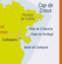
Cap de Creus