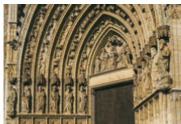
Portalada Santa Maria de Castelló.

est une période essentielle pour comprendre l'Empordà actuel. Ce territoire conserve de très beaux témoignages de cette époque qui en ont fait ce qu'il est aujourd'hui. Le Moyen Âge fut le théâtre de nombreux conflits entre les seigneurs féodaux, surtout entre ceux qui possédaient les plus grands domaines. Dans l'Empordà, le puissant comte d'Empúries qui possédait un vaste territoire, résista longtemps à la Maison de Barcelone mais finit par céder à la vassalité. D'autres luttes et querelles de moindre importance, avec d'autres seigneurs, comme les comtes de Besalú, ceux de Roussillon, les Rocabertí, les Cruïlles ou l'évêché de Gérone conduisirent à couvrir le territoire de villages fortifiés, de châteaux et de palais. C'est de cette histoire que provient l'important héritage architectural médiéval actuel.