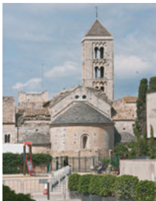
Canònica de Santa Maria de Vilabertran. Aj. de Vilabertran

La primera parte de esta ruta, entre viñas y olivares, nos lleva a conocer los monasterios románicos del Alt Empordà. El itinerario comienza en la canònica de Vilabertran , donde podréis visitar esta bonita abadía agustiniana de los siglos XII-XIII, que conserva la cruz de orfebrería más grande del país, del s. XIV. La ruta continua hacia Rabós d'Empordà, un pueblo donde parece que el tiempo no pasa. En este punto, se toma la carretera que conduce al monasterio benedictino de Sant Quirze de Colera , una joya del románico catalán