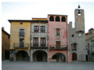
Torroella de Montgrí. Fons Aj. de Torroella de Montgrí

Cette dernière partie traverse la plaine entre le Ter et le Daró. Cette ancienne zone marécageuse a été très disputée au Moyen Âge. Des petits villages, dont certains sont perchés au sommet de collines, composent un paysage dominé par le Montgrí et son château. De Parlavá , suivez la direction de Torroella de Montgrí. En chemin, vous découvrez le village de Fonolles et les quelques vestiges de son ancien château. Quelques kilomètres plus loin, Sant Iscle d'Empordà mérite lui aussi une visite. Continuez jusqu'à Serra de Daró puis prenez en direction de La Bisbal d'Empordà ; vous arrivez à Llabiá , spectaculaire belvédère sur la plaine de l'Empordà. De là, poursuivez en passant par Gualta et Fontanilles, deux villages situés aux portes de Torroella de Montgrí que vous rejoignez par la C-31. Cette ville d'abord comtale devint royale au XIII e siècle. Signalons l'église gothique Sant Genís, les murailles, plusieurs tours et portes ou le château devenu hôtel, le Palau lo Mirador. Pour les plus courageux, la montée au château du Montgrí (45 min à pied) permet de compléter l'aperçu de ce que fut le comté d'Empúries.