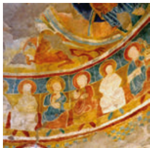
Sant Pau de Fontclara. Aj. de Palau-sator

aquel tiempo, se conservan magníficas muestras que explican cómo es en la actualidad. El pasado fue también un tiempo de luchas entre señores feudales, sobre todo entre aquellos poseedores de grandes dominios. En l'Empordà cabe destacar, por sus dominios y extensión de tierras, el poderoso Conde de Empúries quien mantuvo una fuerte y larga disputa con la casa de Barcelona, aunque finalmente sucumbió a su vasallaje. Hubieron otras luchas y disputas menores, entre otros señores, como los condes de Besalú, los de Rosselló, los Rocabertí, los Cruïlles o el obispado de Girona que llenaron el territorio de villas fortificadas, castillos y palacios, hecho que dejó una región con un rico legado arquitectónico medieval.