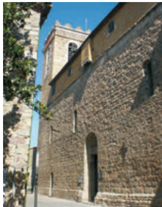
Església de Santa Maria de Darnius. Fons CCAE

vistas excepcionales del macizo del Canigó y de la llanura ampurdanesa. Hay la opción de continuar hacia el municipio de Agullana , donde destaca la iglesia románica de Santa Maria, del s.XII-XIII. La ruta continua hacia la localidad de Darnius para visitar la iglesia de Santa Maria. Luego, se puede ir hasta Albanyà y, de camino, fijarse en la bonita iglesia de Santa Maria de Palau. En el pueblo mismo el itinerario integra el recorrido por el núcleo antiguo y la visita a la iglesia románica de Sant Pere. Albanyà es punto de partida de numerosas rutas para conocer las iglesias románicas en l'Espai d'Interès Natural de l'Alta Garrotxa. De vuelta la ruta lleva a visitar Sant Llorenç de la Muga . De este bonito pueblo, medieval y amurallado, destaca el castillo, la iglesia románica de Sant Llorenç, el Pont Vell y la Torre de Guaita, del s.XIII. Para visitas guiadas contactar con el ayuntamiento.