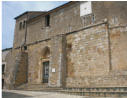
Església de Sant Martí de Vilaür.

medieval. La próxima parada es Sant Miquel de Fluvià . En el centro del municipio sobresale el bello monasterio benedictino, de tres naves, y la silueta de su majestuoso campanario, de la segunda mitad del s.XII, con decoración lombarda. Cerca de aquí está el pueblo de Sant Tomás de Fluvià , que alberga la pequeña iglesia de Sant Tomàs, donde se conservan unas pinturas románicas de reciente restauración de una gran belleza. Para visitarlas es necesario contactar con el Ayuntamiento de Torroella de Fluvià.