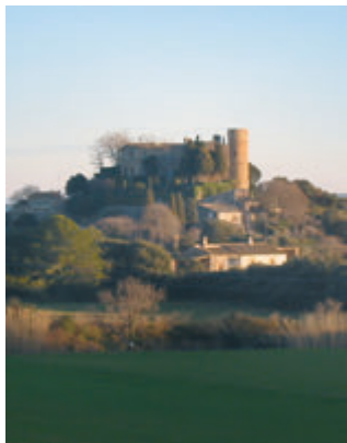
Castell de Foixà.

La ruta continúa desde Monells y por el camino podéis descubrir la pequeña iglesia románica de Sant Andreu de Pedrinyà . Se llega al núcleo elevado de la Pera y, muy cerca, a Púbol, donde el antiguo castillo acoge el Museo Gala Dalí. Saldréis a la carretera C-66, dirección la Bisbal d'Empordà. A pocos metros, a la izquierda, dirección Rupjà. Antes de llegar, no obstante, se recomienda que os adentréis en los dominios de Foixà , villa condal con admirable castillo y magníficas vistas sobre L'Empordà. Los más curiosos