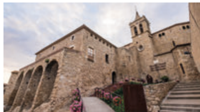
Castell d'Aro.

Los principales señores de la Vall d'Aro durante la edad media fueron el obispo y la catedral de Girona, y los condes de Girona y Barcelona. Más tarde, se añadió el monasterio de Sant Feliu de Guíxols , que ejerció un importante dominio, tanto en la Vall d'Aro como más allá. La ruta empieza en este monasterio benedictino, ya fechado en el s. X y que conserva un elemento emblemático, la Porta Ferrada. Des de aquí llegaréis a Castell d'Aro, conjunto histórico presidido por el castillo de Benedormiens , construido para defender el territorio. La siguiente parada es en Santa Cristina de Aro, donde admiraréis pequeñas iglesias como Santa Maria de Bell-lloc y, más arriba, dentro del espacio natural de les Gavarres, la iglesia de Sant Martí , que pertenece al núcleo de Romanyà de la Selva, las dos son de origen prerrománico. Rodeados de naturaleza descenderéis hasta llegar encontrar el imponente castillo de Calonge , que preside este pueblo. Visitar sus jardines y sus murallas es muy recomendable. Pasando por Sant Antoni de Calonge podéis finalizar en Palamós, villa marinera fundada por el rey durante la segunda mitad del s. XIII. Los más curiosos os podéis acercar a la playa de la Fosca, donde permanecen las ruinas del castillo de Sant Esteve de la Fosca , testimonio en aquella época de muy batallas navales.