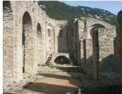
Monestir de Sant Llorenç de Sous (Albanyà).

Esta parte de la ruta se inicia en el pueblo de Lladó , donde se pueden visitar los restos de los edificios que conformaban la antigua colegiata. Del monasterio de Sant Joan solo queda la iglesia de Santa Maria , restos del claustro, de las dependencias monacales y de la sala capitular. Es importante destacar por su importancia el conjunto escultórico de la fachada románica de la iglesia de Santa Maria. El monasterio fue fundado por un monje de la canónica de Vilabertran. De aquí podéis coger la tortuosa carretera local GIP-5237 para visitar el monasterio románico benedictino de Sant Llorenç de Sous , con restos de los siglos XI-XIV. El cenobio está formado por dos cuerpos principales: la iglesia y el claustro con las dependencias monacales. Los restos del edificio han sido recientemente restaurados, y cuenta con carteles explicativos detallados de su historia. Finaliza la ruta en el santuario de la Mare de Déu del Mont , construido sobre un antiguo castillo medieval del s.XIV, con unas vistas espectaculares de L'Empordà y las comarcas vecinas, que inspiraron las obras del escritor Mossèn Cinto Verdaguer.