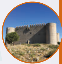
Castell del Montgrí