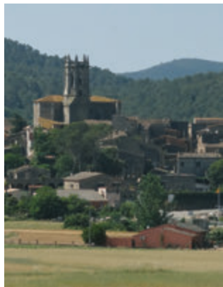
La Pera.

os podéis acercar a la cruz que recuerda al rey Juan I, de quién se dice murió allí estando de cacería. La ruta atraviesa el núcleo de la Sala y los pueblos de Ultramort y Parlavà para llegar hasta Rupià , conjunto histórico que conserva su castillo, antigua propiedad del obispo y hoy sede del ayuntamiento.