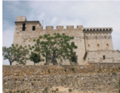
Església Sant Martí del Far d'Empordà. Fons CCAE

La ruta se inicia admirando las vistas excepcionales que se divisan de la llanura, desde el promontorio donde se sitúa la iglesia románica fortificada de Sant Martí del Far d'Empordà , que constituía parte del desaparecido castillo. Podréis continuar por Vila-sacra , para visitar la iglesia de Sant Esteve y el Palau de l'Abat , la historia del cual