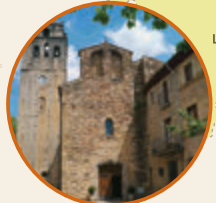
Sant Llorenç de la Muga