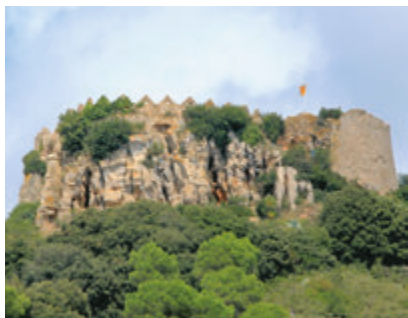
Castell de Begur.

La deuxième partie du circuit débute à Palausator , ensemble médiéval qui conserve une enceinte fortifiée typiquement médiévale. On remarque tout particulièrement la tour des Heures et le donjon qui faisaient alors partie du château. La commune regroupe