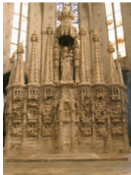
Retaula de la basílica de Santa Maria de Castelló d'Empúries. OT Castelló d'Empúries- Empuriabrava

La ruta comienza en el pueblo de Sant Martí d'Empúries . Situado en un promontorio sobre el mar, que había sido una isla habitada desde los siglos IX-VIII a.C., fue la antigua capital del condado de Empúries, antes que esta capitalidad fuera trasladada a Castelló d'Empúries. El pueblo conserva aún la muralla medieval y diferentes elementos románicos de la iglesia de Sant Martí. Se puede proseguir la ruta hacia el municipio de Sant Pere Pescador, entre marismas y manzanares, y se llega a Castelló d'Empúries . Fue la capital del condado de Empúries desde el s.XI hasta el XV. La basílica gótica de Santa Maria (s.XII-XV), conocida con el nombre de "la catedral de l'Empordà", y los vestigios de los antiguos edificios y conventos son el testimonio del esplendor de este municipio durante la edad media. Otros monumentos importantes son: el Portal de la Gallarda y sus murallas, la Casa Gran (s.XV), la Llotja o Consolat del Mar (s.XIV), el Palau dels Comtes o Convent de Sant Domènec, el Pont Vell, el Rentador (el lavadero), el Call Jueu (barrio judío) y la Cúria-pressó (s.XIV), que alberga el centro de interpretación de la historia de la localidad, así como una colección del patrimonio judío local. Uno de los momentos más mágicos de Castelló d'Empúries llega, cada año, durante la segunda semana de setiembre cuando se celebra el festival "Terra de Trobadors" y la villa retorna a su vibrante pasado de la época medieval.