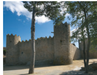
Castell de Calonge. Fons Aj. de Calonge

Los principales señores de la Vall d'Aro durante la edad media fueron el obispo y la catedral de Girona, y los condes de Girona y Barcelona. Más tarde, se añadió el monasterio de Sant Feliu de Guíxols , que ejerció un importante dominio, tanto en la Vall d'Aro como más allá. La ruta empieza en este monasterio benedictino, ya fechado en el s. X y que conserva un elemento emblemático, la Porta Ferrada. Des de aquí llegaréis a Castell d'Aro, conjunto histórico presidido por el castillo de Benedormiens , construido para defender el territorio. La siguiente parada es en Santa Cristina de Aro, donde admiraréis pequeñas iglesias como Santa Maria de Bell-lloc y, más arriba, dentro del espacio natural de les Gavarres, la iglesia de Sant Martí , que pertenece al núcleo de Romanyà de la Selva, las dos son de origen prerrománico. Rodeados de naturaleza descenderéis hasta llegar encontrar el imponente castillo de Calonge , que preside este pueblo. Visitar sus jardines y sus murallas es muy recomendable. Pasando por Sant Antoni de Calonge podéis finalizar en Palamós, villa marinera fundada por el rey durante la segunda mitad del s. XIII. Los más curiosos os podéis acercar a la playa de la Fosca, donde permanecen las ruinas del castillo de Sant Esteve de la Fosca , testimonio en aquella época de muy batallas navales.