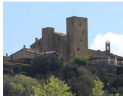
Castell d'Empordà.

El nombre de la Bisbal tiene mucha relación con la figura del obispo, figura muy influyente durante la edad media y con una relación no siempre fácil con el conde de Empúries. La ruta comienza en el Castillo Palacio de la Bisbal d'Empordà , residencia del obispo de Girona y una de las muestras más importantes del románico civil catalán. Sin dejar el pueblo, podéis acceder al Castell d'Empordà , actualmente un hotel, pero que fue construido por el conde, al límite de sus dominios y como respuesta a la construcción del Castillo de la Bisbal, muestra de los beneficios otorgados al obispo por el soberano. Las vistas son excepcionales. Seguiréis la ruta hasta Corçà , donde podéis admirar su casco antiguo o acercaos al bonito pueblo de Casavells, a escasos kilómetros. La ruta se desvía por la GIV-6701 hasta llegar a Monells, dejando al lado la iglesia de Santa Cristina . En Monells encontraréis una plaza que conserva de forma extraordinaria su origen medieval.