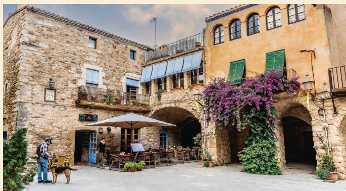
Centre històric de Peratallada