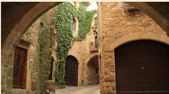
Centre històric de Pals