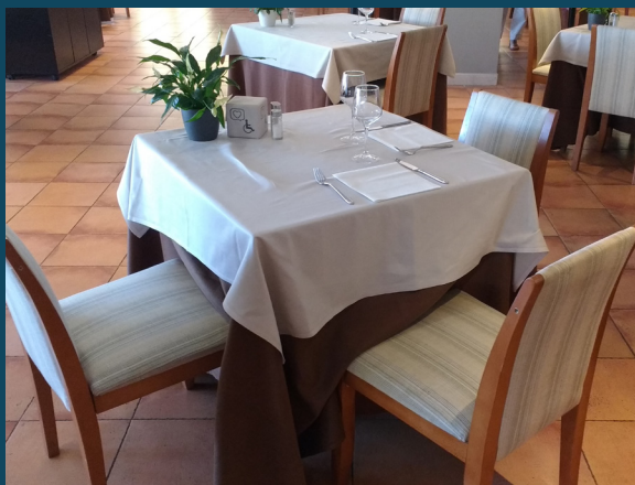
Hotel Ilunion Caleta Park

Totes les propostes que trobareu a continuació han estat prèviament validades per una empresa especialitzada en accessibilitat turística i responen a la voluntat d'empreses i d'entitats turístiques de la comarca, públiques i privades, d'oferir uns serveis i unes instal·lacions cada cop més adaptades i per a tothom. Veureu que cada proposta ofereix facilitats per a necessitats diferents. Les icones us ajudaran a veure a qui es dirigeix cada proposta.