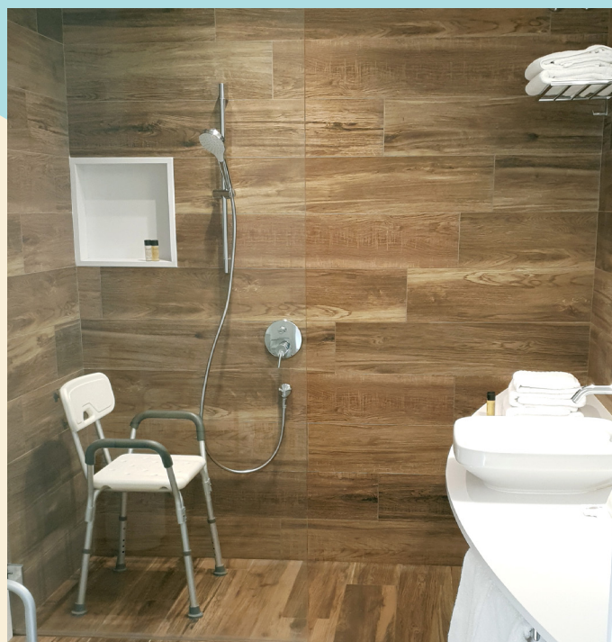
Hotel Can Miquel