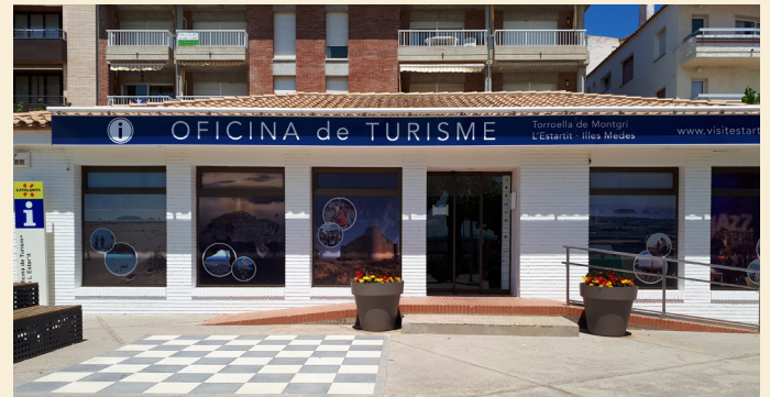
Oficina de turisme de l'Estartit