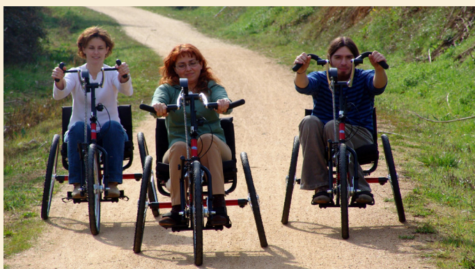
Via Verda El Carrilet