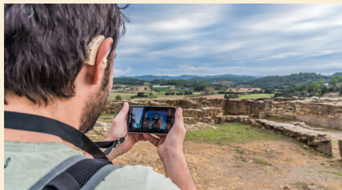
Museu d'Arqueologia de Catalunya - Ullastret (@INMEDIA)