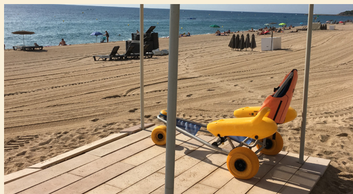
Platja Gran de Platja d'Aro