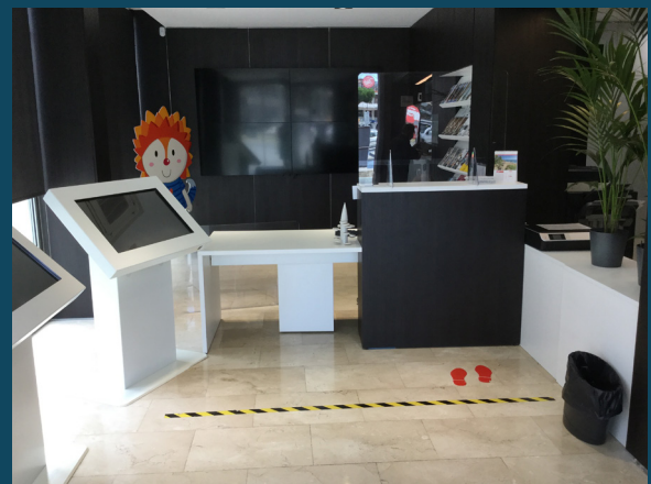
Oficina de turisme de Castell - Platja d'Aro